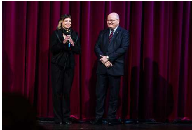
Úvodní slovo ministra kultury