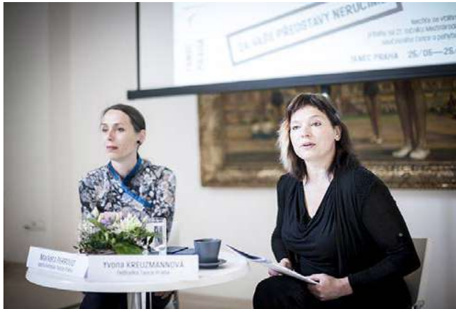
Tisková konference na zahájení festivalu