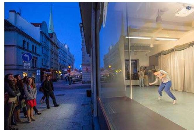
news garden / private echoes v Plzni