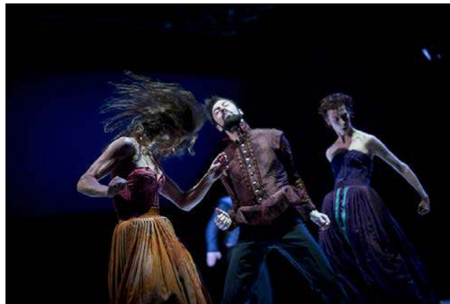
Histoire de l'imposture