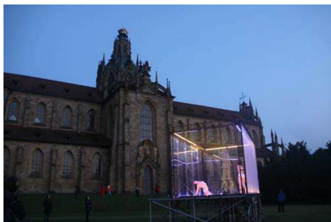
Animal Exitus v Kladrubech