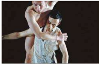
Emotionale Verwicklungen bei Sasha Waltz.

Tanz ist für Sasha Waltz eine universelle Sprache, ein Botschafter für eine friedliche Welt, für Gleichheit, Toleranz und Mitgefühl. Wie viele weitere Künstler stellt die deutsche Choreographin ihr neues Programm beim Tanzfestival in Prag vor. Tanz – das sind nicht nur Ballett-Klassiker wie „Schwanensee“ oder „Der Nussknacker“. So wie Theaterhäuser nicht nur Shakespeare und Goethe im klassischen Sinne auf die Bühne bringen, entwickelt sich auch das Genre der Bewegungskunst unaufhörlich weiter und bewegt sich am Puls der Zeit. Die neuesten Experimente der internationalen Szene können