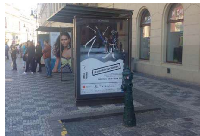
CLV na zastávkách MHD v Praze