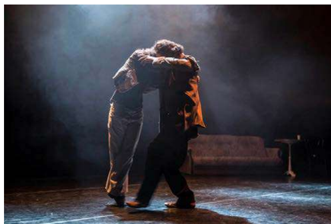
Quilombo v Hradci Králové