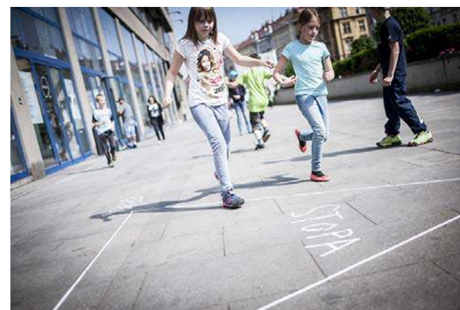
TP DĚTEM - Stopy a otisky