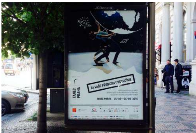
Výlep CLV v Praze