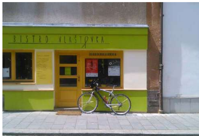
Výlep plakátů regionálních partnerů