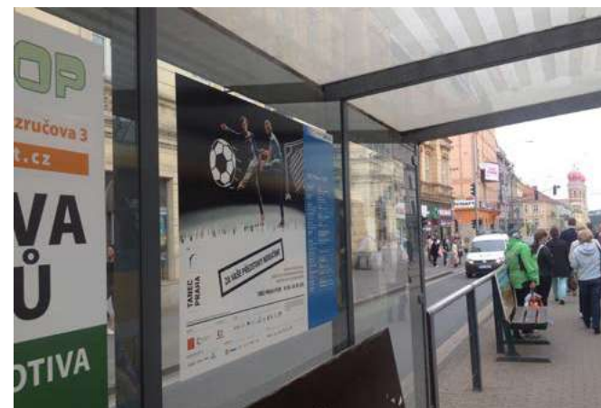
Samolepky na zastávkách v Plzni