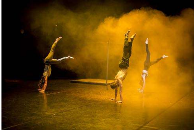
SKIN ME