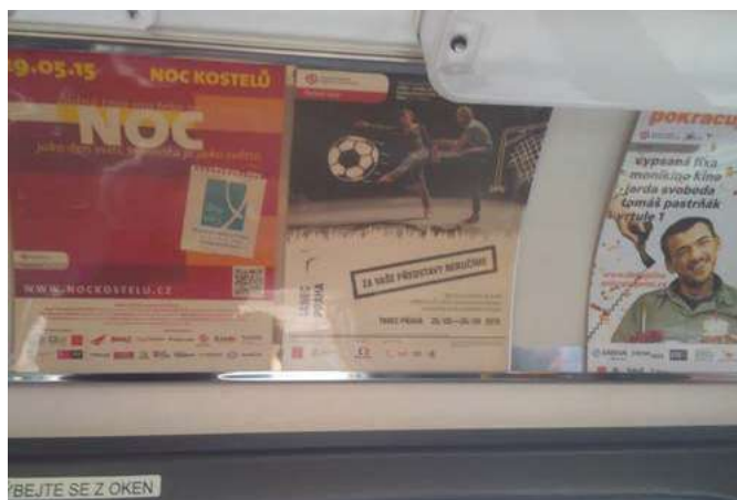
Plakáty A4 v tramvajích