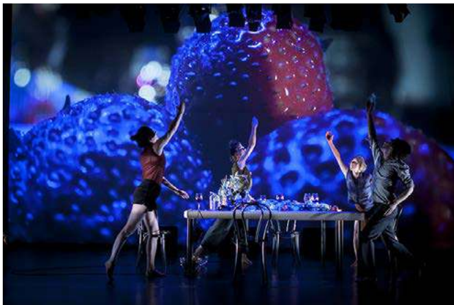
Deep Dish