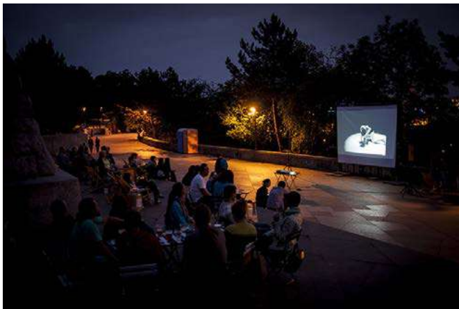
Filmová projekce na Stalínu