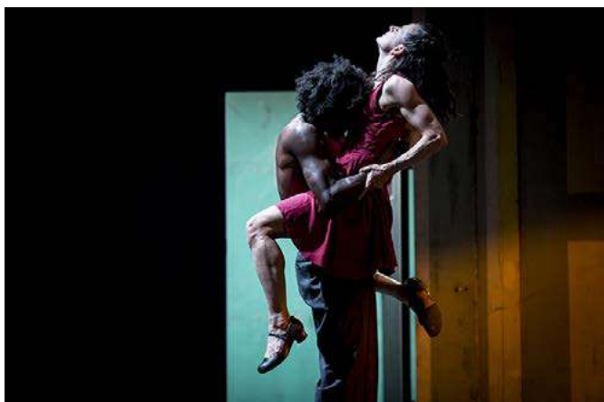
Travelogue I - Twenty to Eight v Plzni