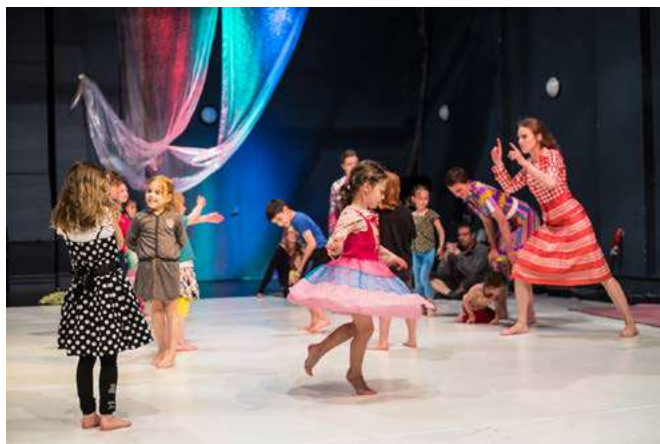
TP DĚTEM - otevřená hodina DS