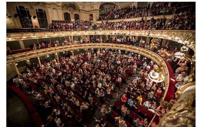
Ovace pro Batsheva Dance Company