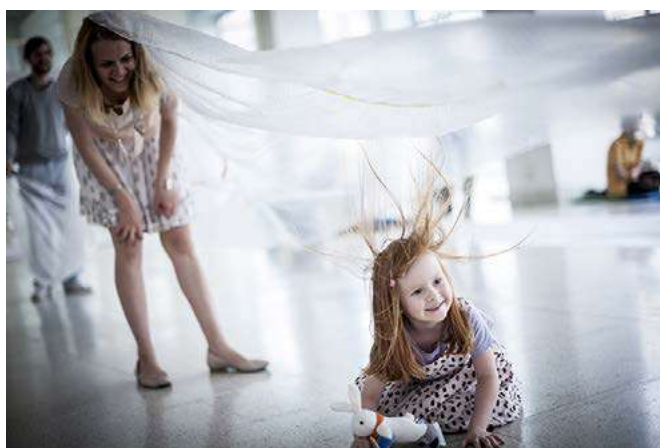
TP DĚTEM - Stopy a otisky