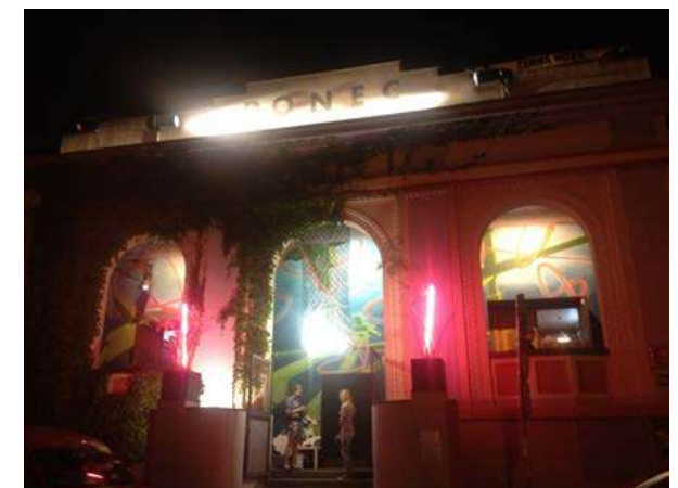
Festivalová výzdoba divadla PONEC