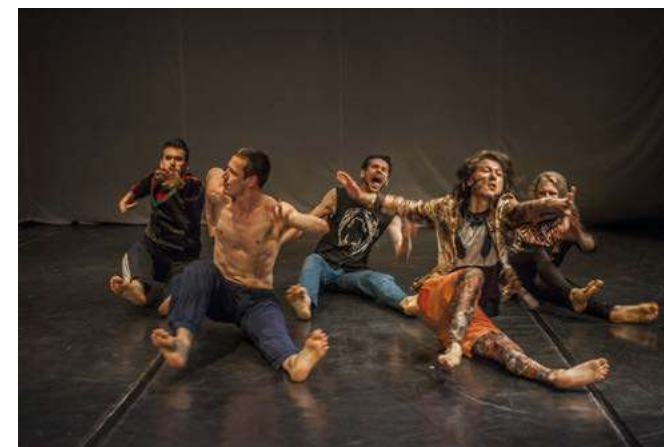
Collective Loss of Memory v Ostravě