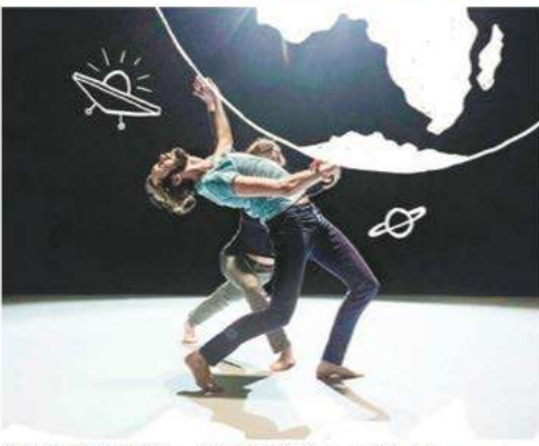
HRAVOST A PŘEDSTAVIVOST doprovází letošní ročník festivalu i ve výtvarní podobě.

Vysoce kvalitní zahraniční program vybírá Umělecká rada ze stovek nabídek, řadu