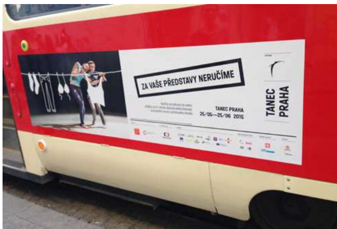
QS folie na tramvajích v Praze