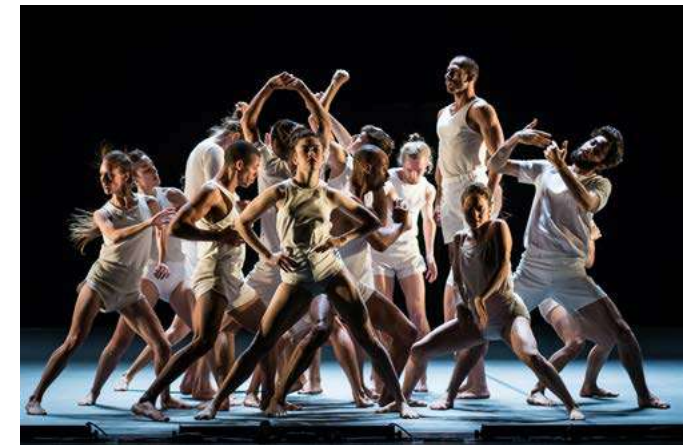
"LAST WORK"