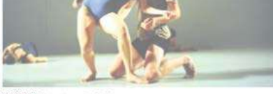
HISTOIRE DE L'IMPOSTURE.