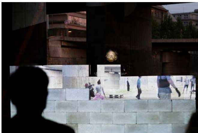
Performativní biograf v Plzni