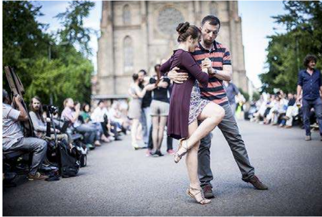
Tango na Mírákú