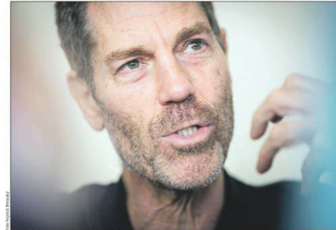
Ohad Naharin se postará o finále letošního Tanec Praha.

■ Z nového díla mám dobrý pocit a nemůžu nic společného s mým egem, i když ho mám. Jde o to, nechat se vést jinými věcmi, které jsou mnohem důležitější. Dílo za půli roku skutečně vytvořilo, ale pak třeba přijde někdo a řekne - Šakra, co to je? To už není o úrovni mě připravily, ale také o schopnosti vědět, co nabízejím, protože jsem připraven na