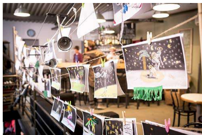
TP DĚTEM - obrázky dětí