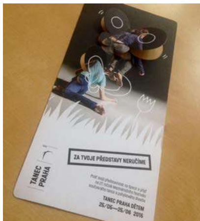
Leták na TANEC PRAHA DĚTEM