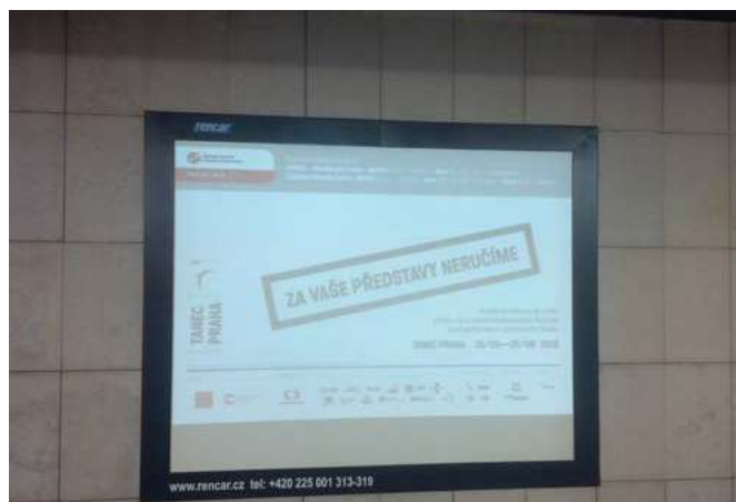
Spot na obrazovkách Metrovision v metru