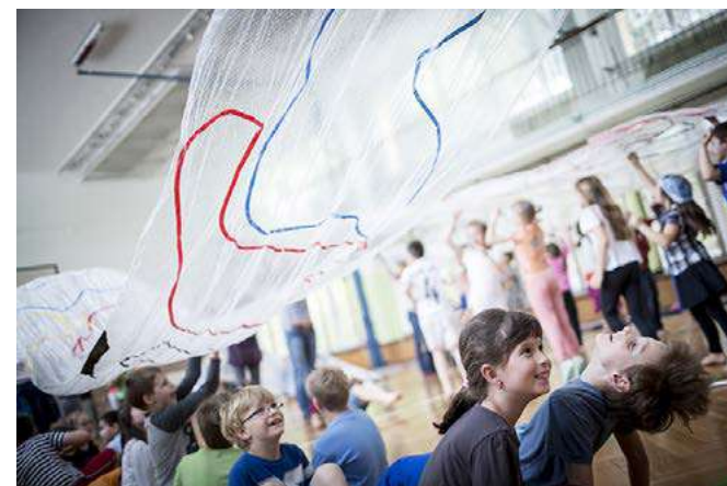
TP DĚTEM - Dílny na školách