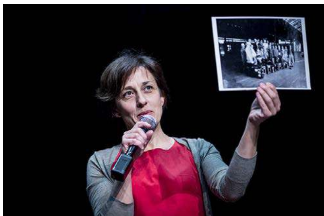
TP STUDENTŮM - An Introduction