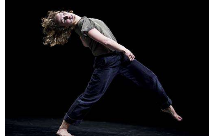
Qui, ora