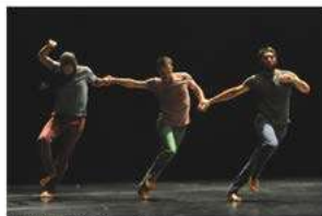
Ilustrační foto - Tanec Praha Tanec Praha s.r.o.

vydána: 18.03.2015, 15:39 aktualizace: 18.03.2015, 15:47