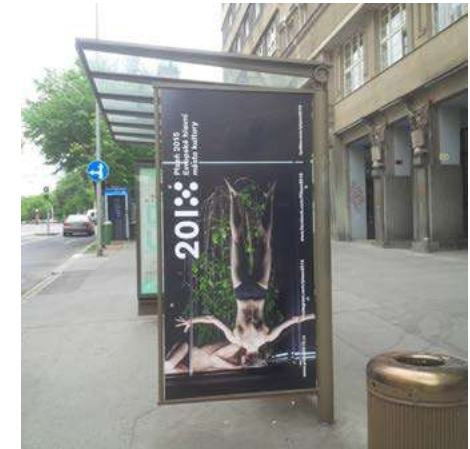
Upoutávky na taneční program Plzně 2015