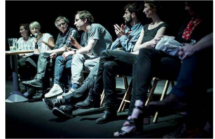
Diskuze s umělci po představení