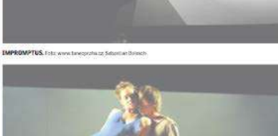
LAST WORK.