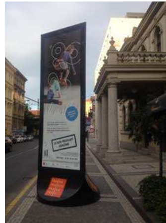
Banner před Hudebním divadlem Karlín