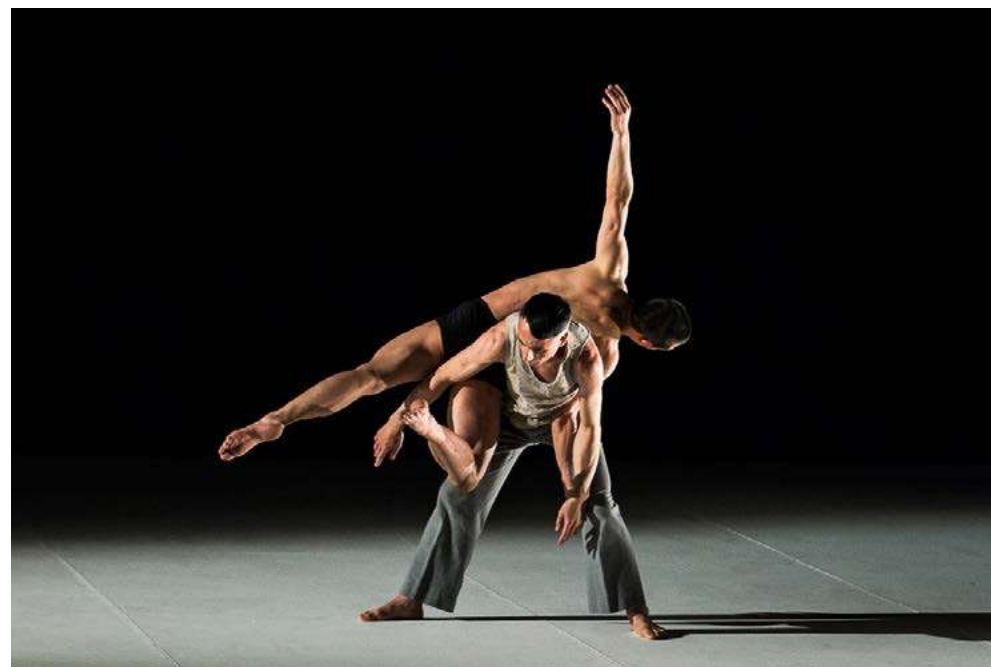
Sasha Waltz & Guests: Impromptus

24. + 25. 6. | 20:00 | Hudební divadlo Karlín | GALA CLOSING / UDÁLOST SEZONY Batsheva Dance Company / Ohad Naharin (IL) : "LAST WORK"