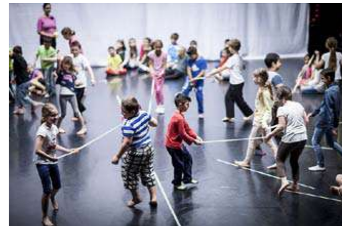
Dopolední dílny pro děti ze ZŠ Cimburkova a ZŠ Jarov