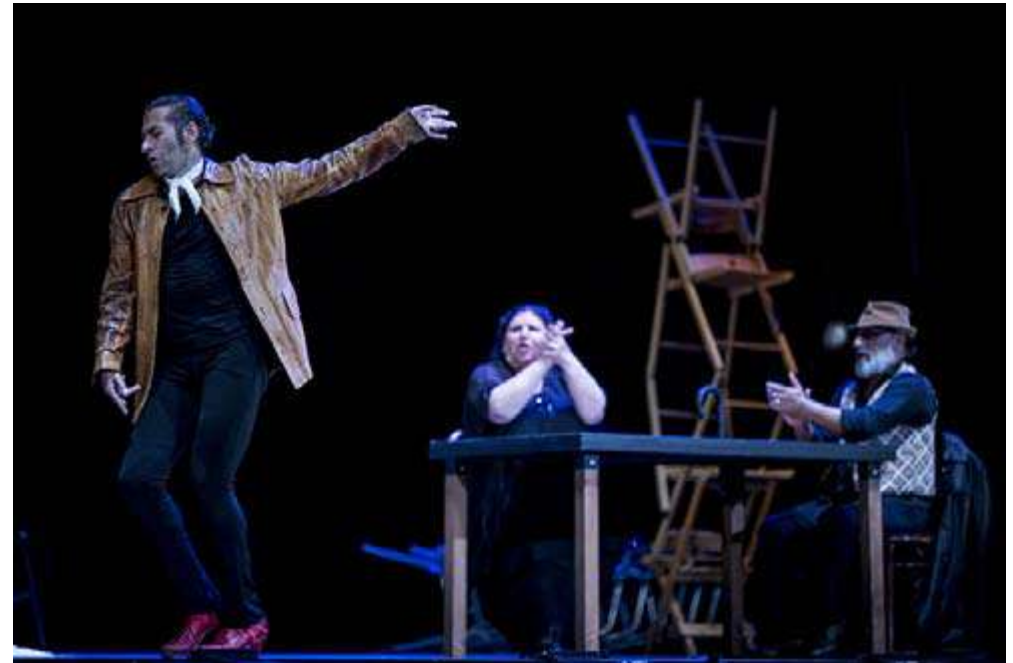
Israel Galván (ES): La Curva, foto: Vojta Brtnický

22+23/06 | 20:00 | Hudební divadlo Karlín | UDÁLOST SEZONY Israel Galván (ES): La Curva