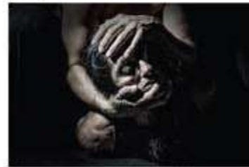
13. června 2016, 11:12 (aktualizováno 10:55) Zdroj