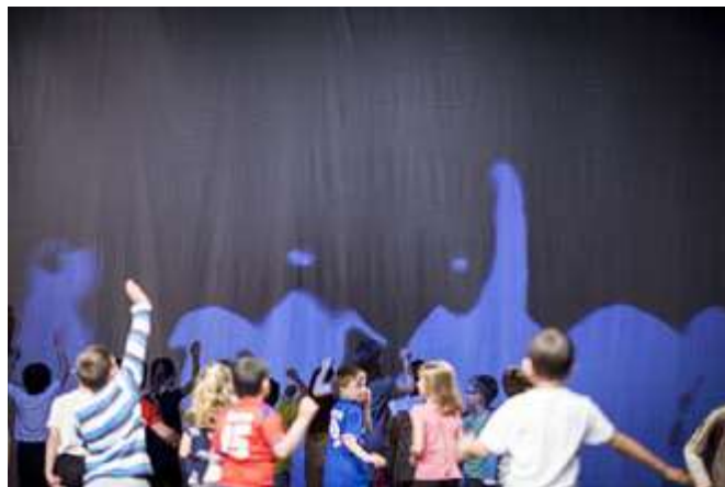
Prezentace hodin taneční a pohybové výchovy