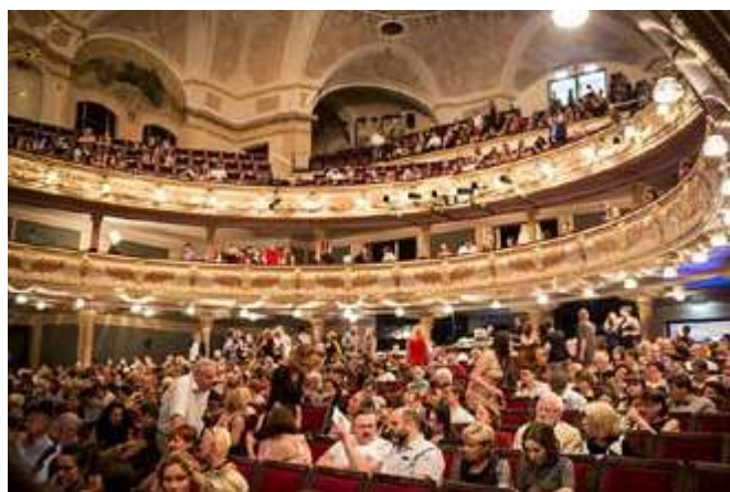
Diváci v Hudebním divadle Karlín