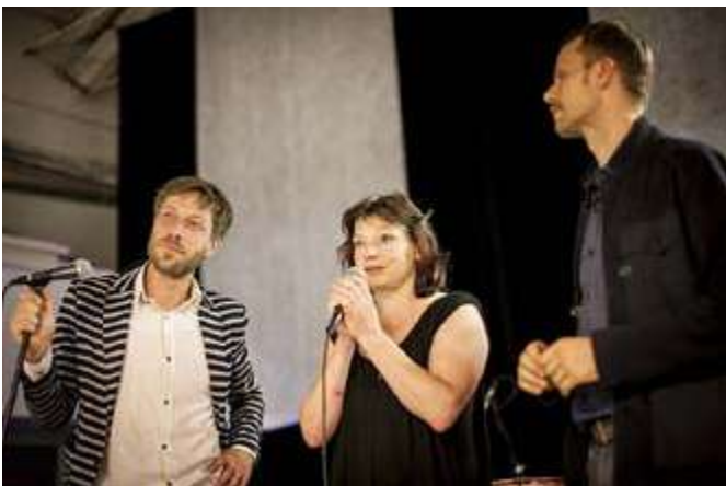
Zahájení festivalu - Jatka 78