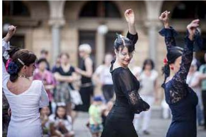
VEN.ku TANCI Tančírna: Flamenco na Piazzettě, foto: Vojta Brtnický