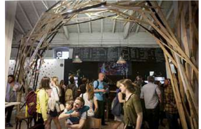
Zahájení festivalu - Jatka78