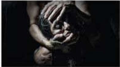
13. června 2016, 11:12 (aktualizováno 10:55) Zdroj