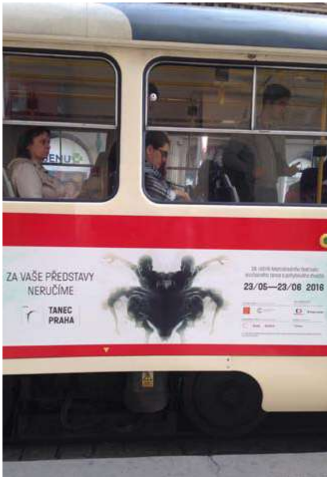
QS fólie na tramvajích