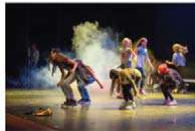
Tanec Praha nabízí workshopy pro děti i dospělé

Festival Tanec Praha se nekoná jen v hlavním městě, jak napovídá název akce, ale i v dalších obcích Česka. Hlavní hvězdou celé akce je král současného flamenca Israel Galván. Zatančit si však můžou úplně všichni.