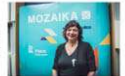
31. května 2016, 11:12 (aktualizováno 10:55) Zdroj