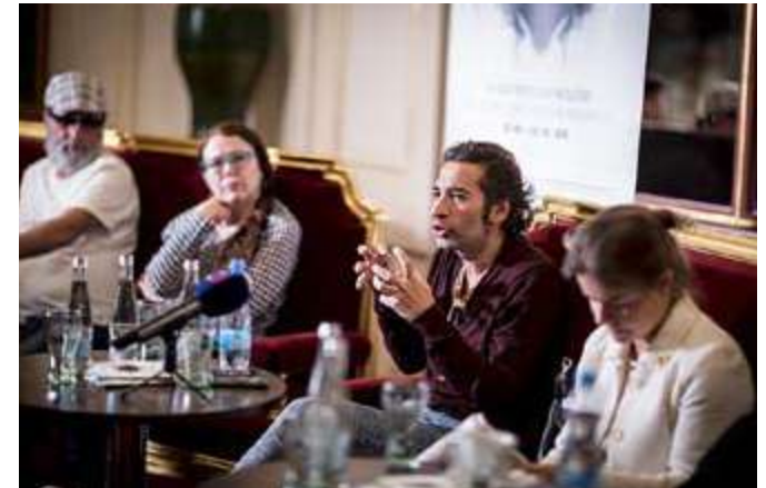
Diskuse s Israelem Galvánem v Hudebním divadle Karlín