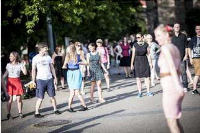
VEN.ku TANCI Tančírna: Swing na Míráku