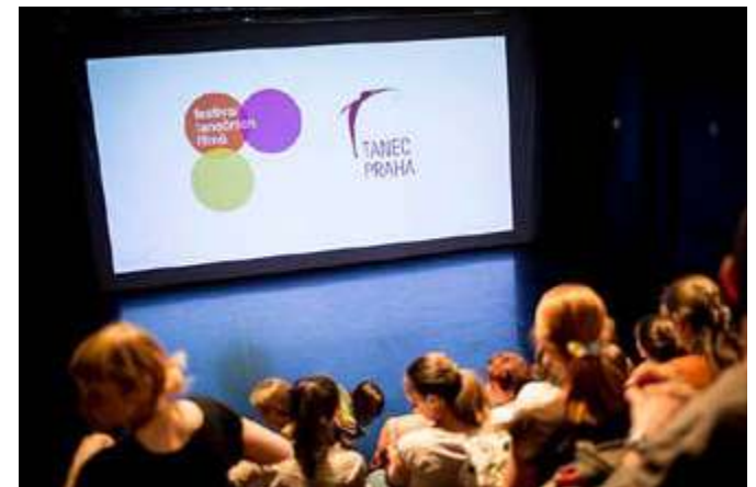
Projekce filmu o Israelu Galvánovi