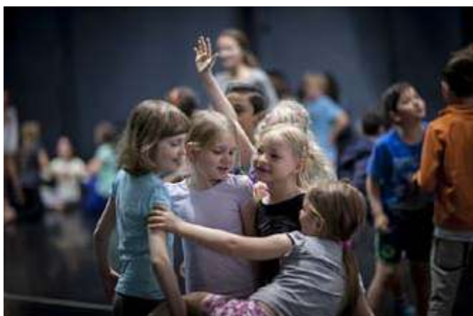
Dopolední dílny pro děti ze ZŠ Cimburkova a ZŠ Jarov