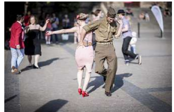
VEN.ku TANJI Tančírna: Swing na Míráku