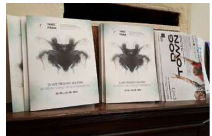
Roznos tiskovin po kavárnách a spřátelených institucích