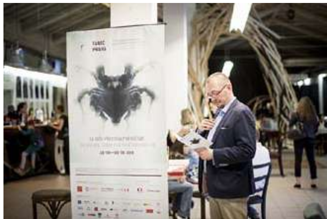
Zahájení festivalu - Jatka 78