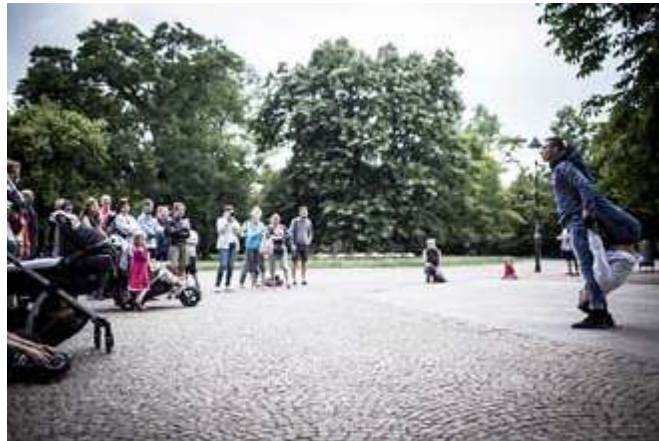
Los INnato (CR): Etérea