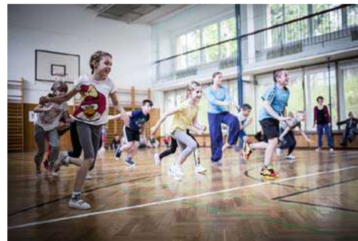
Tanečně pohybové dílny pro děti z projektu Tanec Školám