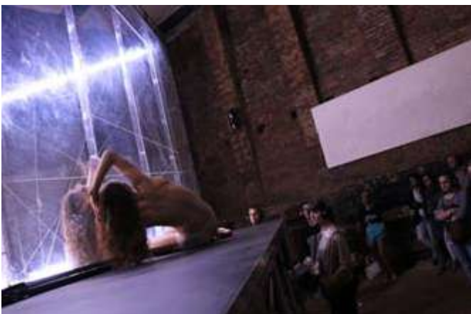
Spitfire Company (CZ): Animal Exitus v Liberci