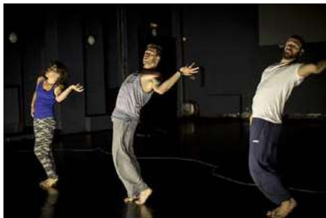
Ann Van den Broek/WARD/WARD (NL/BE): Black Piece