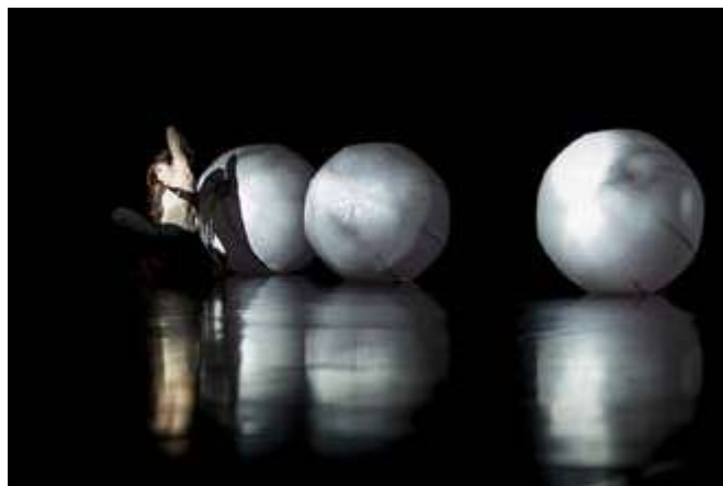
Heamin Jung (KR): Act%