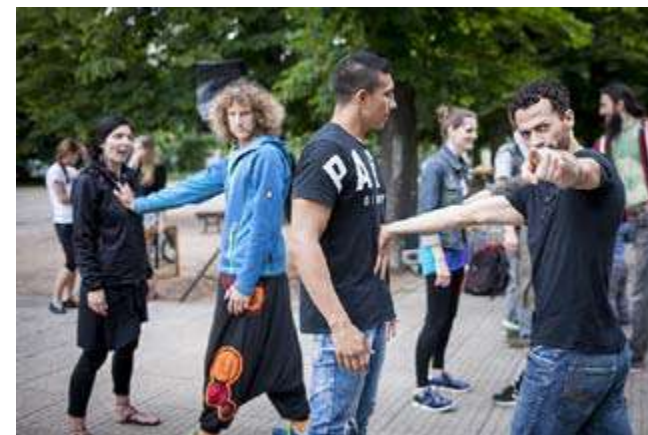
Los Innato (CR): Etérea – pohybový workshop