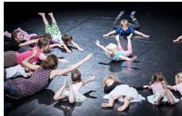
Dětská slavnost – Otevřená hodina Dětského studia divadla PONEC

V rámci doprovodného programu VEN.ku TANJI.